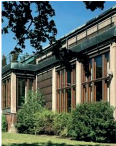
Norska Ambassaden i Stockholm